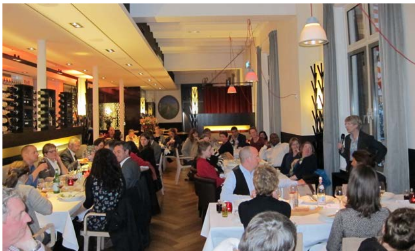
Les membres d'Ariadne au dîner de réseautage et de briefing politique